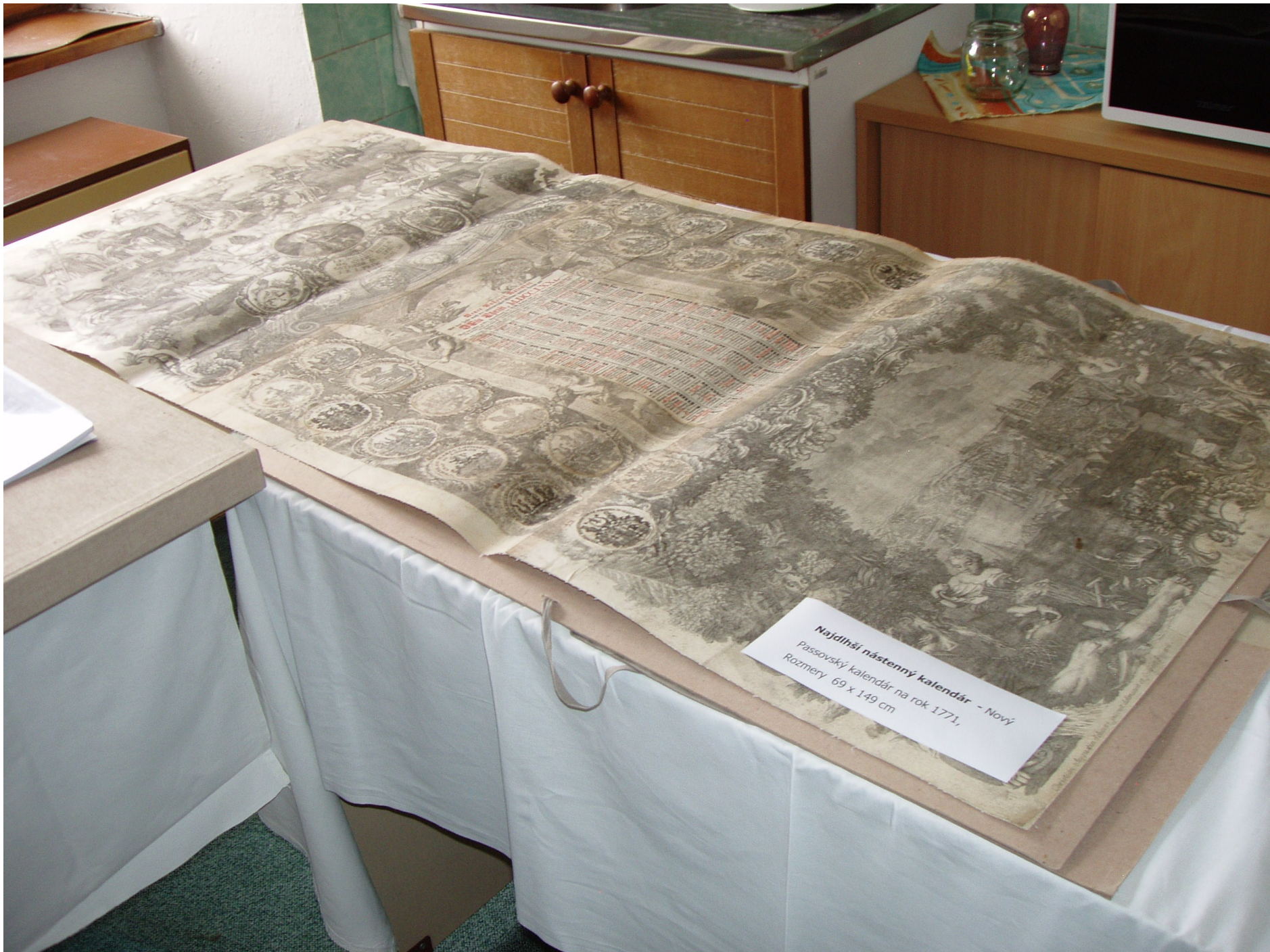
Najdlhší nástenný kalendár - Nový Passovský kalendár na rok 1771, Rozmery 69 x 149 cm